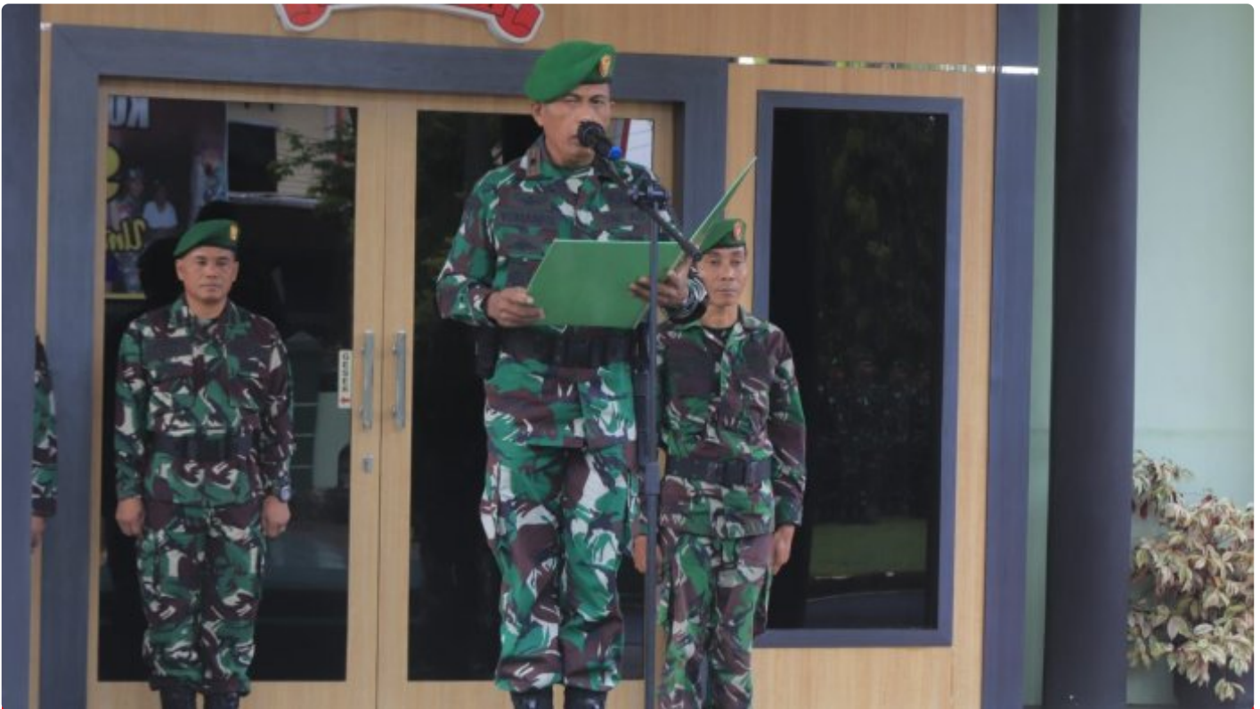
Makna Upacara Bendera Merah Putih Dibulan Suci Ramadhan Bagi Prajurit Kodim 1006/Banjar

MARTAPURA - Bagi Prajurit TNI AD Upacara Pengibaran Bendera Merah merupakan suatu keharusan dilaksanakan.